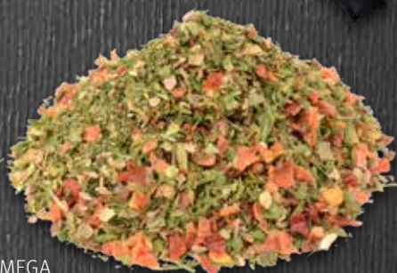
MEGA Salatkräuter 500-g-Packung Nr. 5233900