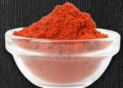
MEGA Paprika edelsüß 1-kg-Packung Nr. 5228800