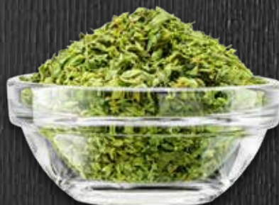
MEGA Oregano 1-kg-Packung Nr. 5229300